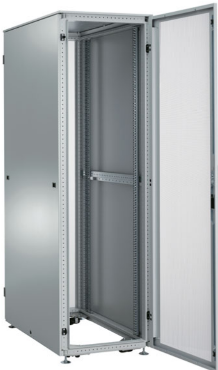
Tür komplett passiv belüftet