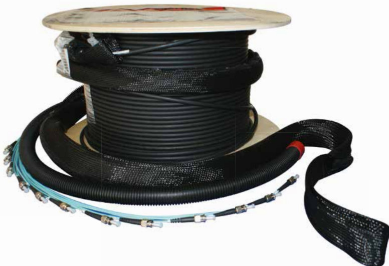
Bsp.: Vorkonfektion KUF-122-3-30-30-x